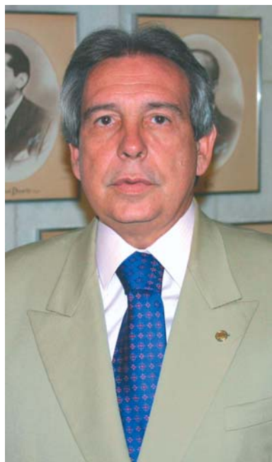
Deputado Paulo Magalhães, Relator da PEC 185/2003, deu um parecer histórico

A CCJC da Câmara dos Deputados aprova parecer do Deputado Paulo Magalhães (PFL-BA) pela admissibilidade da PEC 185/2003, que dá foro constitucional aos Conselhos Federais de Profissões Regulamentadas e cria regras para o seu funcionamento.